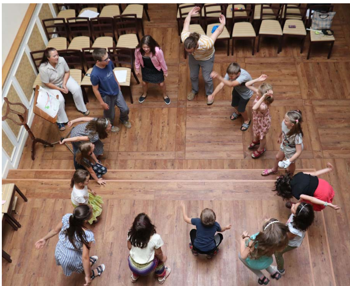
Soustředění hudební improvizace v ZUŠ Jihlava, 30. 6. až 4. 7. 2019