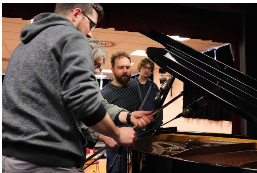
Seminář pro učitele v ZUŠ Náchod, únor 2020