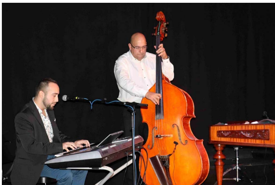
Koncert v září 2019 v Brně